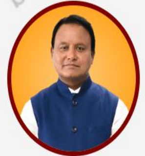
ଶ୍ରୀ ମୋହନ ଚରଣ ମାଡ଼ି ମାନ୍ୟବର ମୁଖ୍ୟମନ୍ତ୍ରୀ