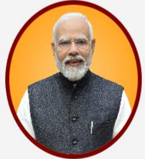
ଶ୍ରୀ ନରେନ୍ଦ୍ର ମୋଦି ମାନ୍ୟବର ପ୍ରଧାନମନ୍ତ୍ରୀ